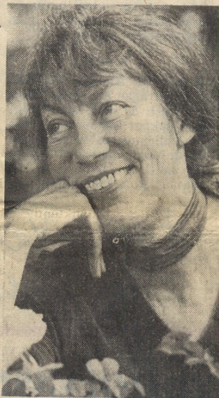
"Den viktigaste kampen är kampen mot det patriarkaliska förtrycket."

— Begrepp som makt och ledarskap har börjat omdefinieras inom feminismen som ett slags roterande balans mellan individ och grupp. Makt för kvinnor innebär för mig först och främst makt, kontroll, över våra kroppar. De har alltför länge utsatts för rovdrift, för att inte säga gruvdrift. Föreställ dig vad denna kontroll innebär i sina konsekvenser!