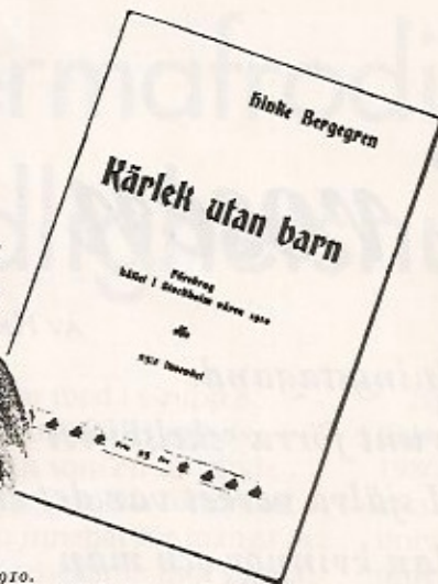
Kärlek utan barn. Skrift av Hinke Bergegren 1910.

Offentliga möten. OBS! Endast för män håller på uppmaning Hinke Bergegren nu om fredag (8 april) i Folkets Hus' A-sal föredraget Kärlek utan barn.