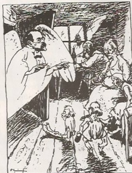
Ett glatt budskap. — Glädjens och fröjdens, kära vänner, ty nu finnes ingenting som hindrar er att få så många barn ni vill!