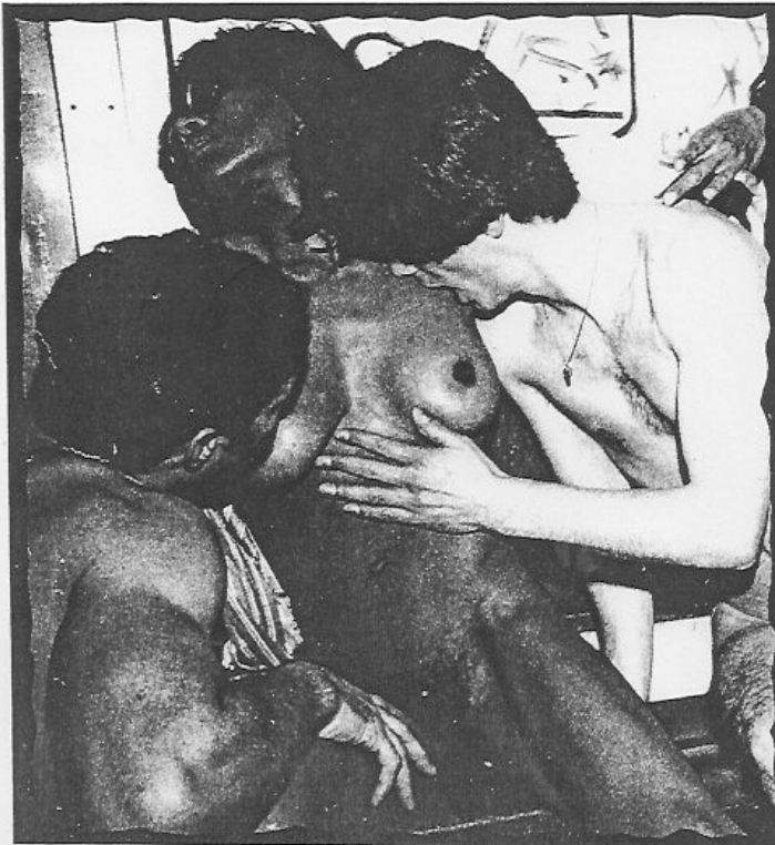
Drömmen om frihet? Ett bildreportage om sex i tunnelbanan ur herrtidningen Stopp. Sexuell frihet har länge åberopats som ett medel mot dåliga samlevnadsförhållanden. Vad den slutliga frigörelsen innebär har ingen klargjort.

Pornografins "demokrativering" tycks ha bestått i att porren blivit allt grövre, råare och mer våldsbetonad. Dess våldskanaliserande funktion har gjorts tydligare. Gamla republikanska konstteorier har spelat större roll än vi tror för vår egen tids sexualpolitik. I slutet av 50-talet gav H-son ut Justine, den bok som åsamkade de Sade, som dödat två kvinnor med sina sadistiska experiment, ett långvarigt fängelsestraff. H-son berömdes på DN:s kultursida. Sedan blev "allt tillåtet" i början på 70-talet när de ekonomiska konjunkturen började bli sämre. Den kulturella sadismens ideologi sprids nu i massupplagor. Videokassetternas våldspornografi håller på att erövra hemmen. Undersökningar har visat att pornografisk film ofta-