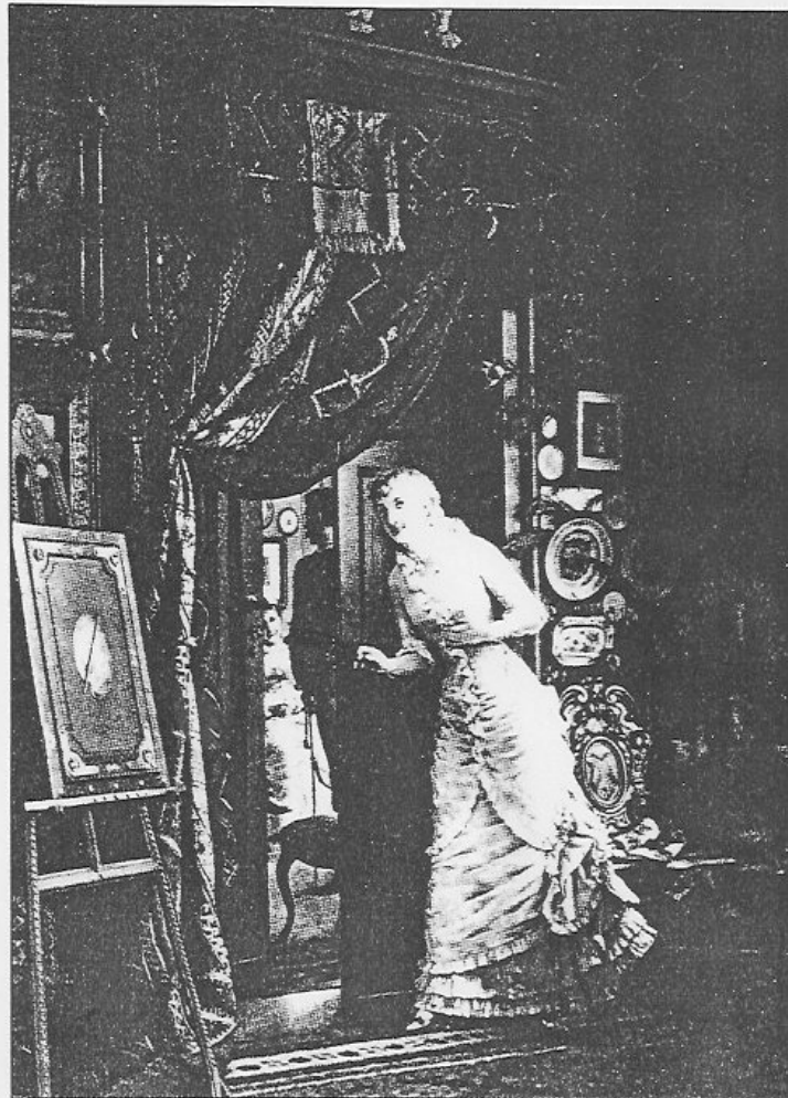
Bild vänster och nedan. Sexuell atmosfär under tystnadens århundrande, 1800-talet. (Illustration ur boken "Die gute alte Zeit im Bild")