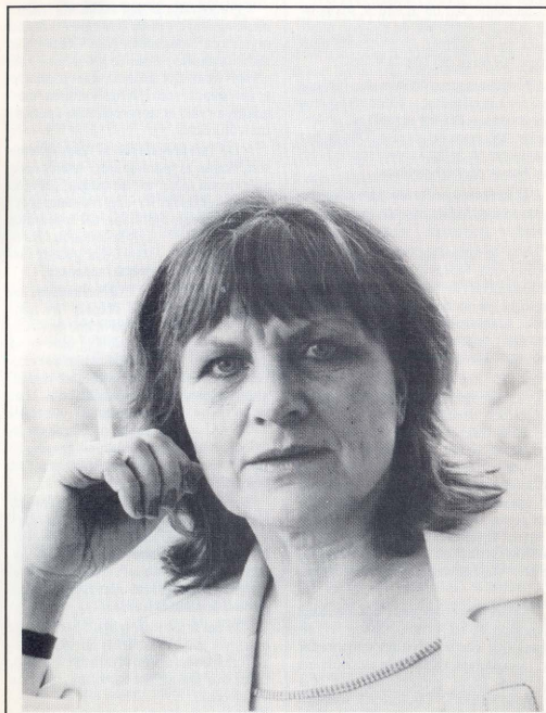
- Det förväntas av mig som kvinna att jag ska ha god hand med blommor. Trots att jag inte har några blommor i mina fönster anser jag mig vara lika mycket kvinna för det.

- Sexualitet definierar jag i ett vidare begrepp än vad som vanligen görs. Med sexualitet innefattar jag hela det sexuella kulturmönstret med dess könsroller, där man trycker ner kvinnan genom att poängtera skillnaderna mellan könen istället för att visa på likheterna. Ursprungligen betyder också ordet "Sexus" att skilja, sära.