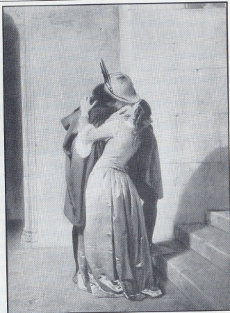
Il bacio (kyssen) av Hayez.

- Erotiken, passionen för den andre lyser genom kläderna. Det behövs ingen nakenhet och det är oväsentligt om de här två personerna kommer att ha samlag eller inte. Gemenskapen, närheten, ömheten, ömsesidigheten finns i bilden, även om allt detta inte finns i verkligheten. Kanske var han en förförare, vem vet? Jag hoppas att han inte var det, för bilden gör mig glad och lyckligt stämd. Den får mig att hoppas på en framtid.