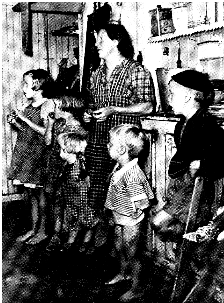
men för det fanns inte tid och råd för arbetarkvinnan. Hennes "fostran av barnen" var ofta en fråga om överlevnad, om att slita för att få mat till barnen.