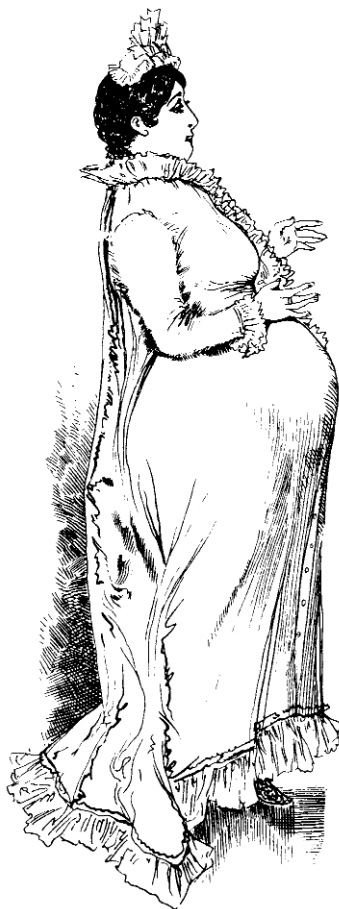
Överklasskvinnans uppgift blev att vara "hemmets ängel"... Bild ur wiensk tidning 1901 (Ur Nørgaard: "När damerna fick ben" R&S)

Den sysslolösa överklasskvinnan ammade inte sina barn och tjänarna skötte dem.