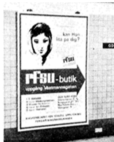
En vanlig annons år 1962.

Även för vuxna kvinnor fungerade preventivrådgiv- ningen under många år myc- ket bristfälligt. Mödrvårds- centralerna dröjde länge in- nan de tillhandahöll en ade- kvat rådgivning. Dels berodde detta på bristande resurser, dels på personalens inställ- ning. Inte förrän 1972 ordna- des den första kursen för barnmorskor i antikonception och preventivmedelsrådgiv- ning. Ända till och med 1957 stod RFSU så gott som ensamt för svenska kvinnors tillgång till preventivmedel. Så här gick det till på riksförbundets klinik på Kungsgatan 1954: